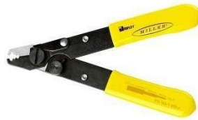
3. Alicates de fibra