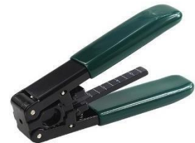
4. Decapador de Drop